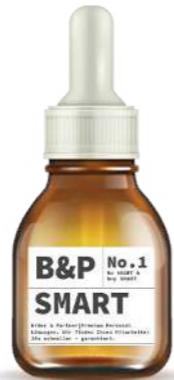
B & P N O . 1 S M A R T Be smart & buy smart

Wir lieben unsere SMART Lösung, denn sie bietet Ihnen alles was Sie brauchen um mit uns auch zukünftig erfolgreich zusammen zu arbeiten bei nahezu null Risiko. Einfach SMART.